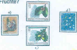
(Eine der 12 Fragen)

Ein paar m weiter oben steht eine riesige Buche. Welches sind ihre Früchte?