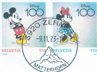
Blockausschnitt mit dem Orts-Ersttags-Stempel von Zermatt

(Die Jahresberichte ab 2010 sind farbig auf unserer Homepage www.philatelie.org )